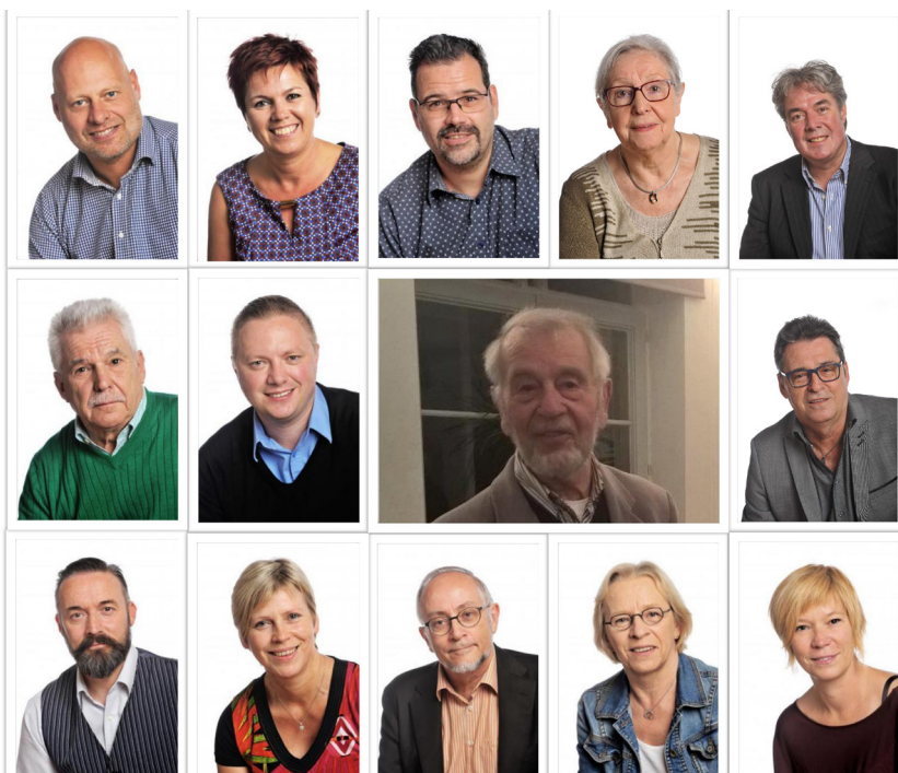
Deze N-VA-ploeg zal de gemeenteraadsverkiezingen van 2018 voorbereiden.