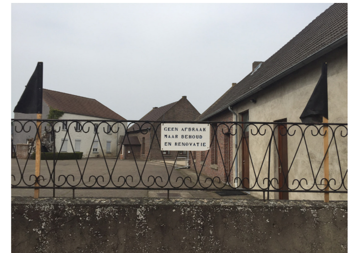
Kunnen verenigingen in de toekomst nog steeds terecht op Bergerkamp?

Voor het westelijk deel (Chiro en K.A.J.) zou de toestand blijven zoals die nu is. Voor het oostelijk deel (klooster en schoolgebouwen) is er de optie om hier al in juli 2016 werk van te maken.