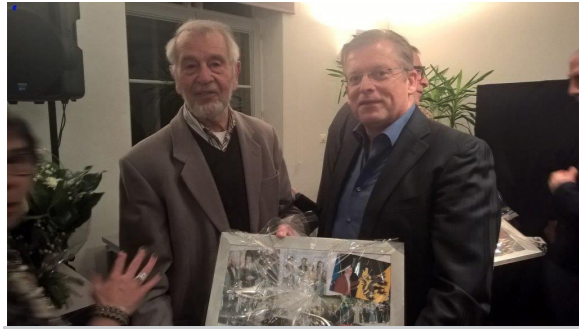
De N-VA-fractieleider werd in de bloemetjes gezet voor zijn jarenlange inzet in gemeente- en OCMW-raad.

Rutten in wat toen nog de Commissie van Openbare Onderstand heette. In 1976 werd hij voor het eerst als gemeenteraadslid verkozen, maar door familiebanden met een andere verkozen kon hij niet zetelen. De volgende zes jaar zou hij daarom in het OCMW zetelen.